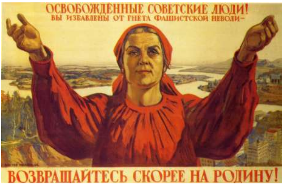
Радянський плакат із закликом до громадян СРСР повертатися на батьківщину. 1945 р.